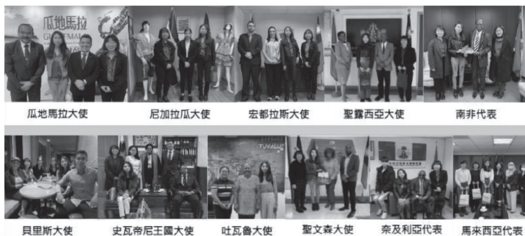
台灣數位外交協會致力於以民間力量來深化與邦交國之關係及非邦交國之連結

最後本協會也將進行媒體環境研究與輿情蒐集分析，藉蒐集媒體報導資訊、訪談當地記者、分析社群媒體上的對台討論、意見領袖特性與網絡，提供深度的宏國媒體生態調查，作為我國公、私部門在當地推廣業務之參考。以宏國作為先鋒試驗點，此模式更可被複製應用於在其他國家的媒體公關業務，值得我國青年關心並投入。